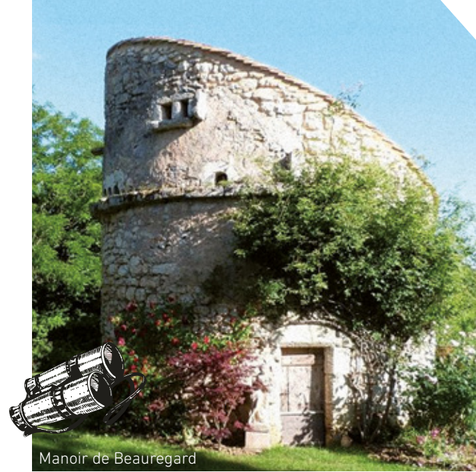
Manoir de Beauregard

Au cours de votre promenade de 6 km vous apprécierez la vue sur le château de la Gaubertie et sur une tour de garde du XII e siècle réinvestie en pigeonnier.